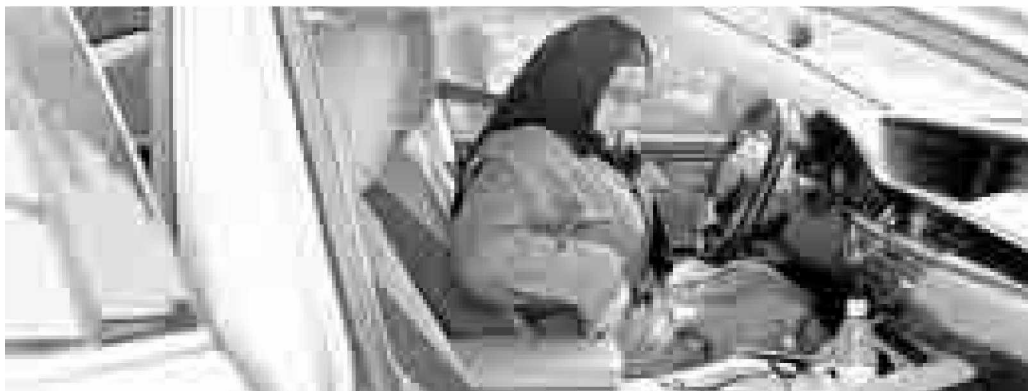
En la empresa Careem, dedicada a la renta de autos en la capital de Arabia Saudita.

Facebook, Twitter: galvanochoa Correo: galvanochoa@gmail.com