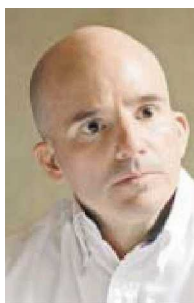
José Antonio González Anaya