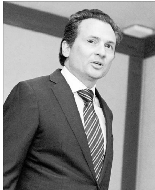
Emilio Lozoya Austin fue director de Pemex de 2012 a 2016.

Facebook, Twitter: galvanochoa Correo: galvanochoa@gmail.com