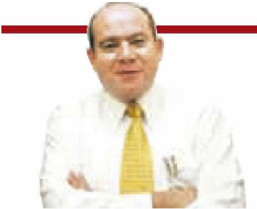
JULIO BRITO A.

Sólo que Trump quiere defender el empleo de manufactura de sus compatriotas y con la respuesta de AMLO pues abona a que los empleos se vayan de México, tal y co-