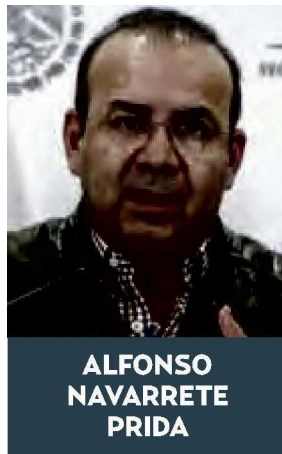
ALFONSO NAVARRETE PRIDA

Curiosamente debido a la participación del crimen organizado, que ahora ha encontrado en ese ámbito un muy buen negocio, para el transporte terrestre se ha hecho de un alto riesgo la carretera México-Pue-