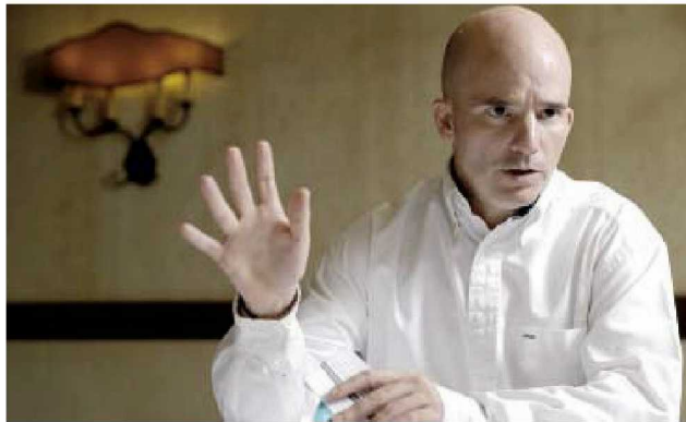
José Antonio González Anaya