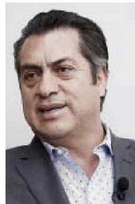
Jaime Rodríguez Calderón