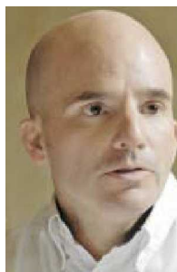
José Antonio González Anaya