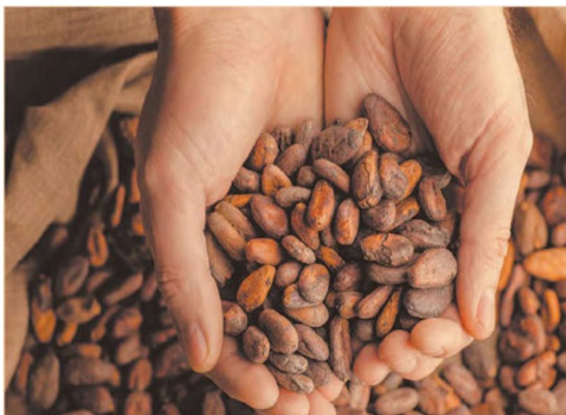
FIRA apoya con créditos a los pequeños productores de cacao, hombres y mujeres, donde se reduce la brecha tecnológica.