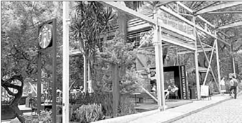
▲ Trabajadores de Starbucks aseguran que no han sido notificados sobre las medidas a seguir ante un posible agravamiento de la epidemia de Covid-19.