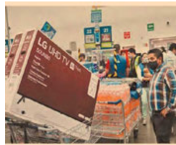
Las ventas del Buen Fin deben impulsar al sector comercio.

De manera más significativa y con mayor repercusión para las ventas, están las restricciones en el aforo en tiendas donde en algunas solo se permite el 30% de capacidad, así como días sin poder operar. Los horarios de apertura han sido extendidos buscando limitar el número de personas dentro de las tiendas y así promover la sana distancia. Esto ha provocado una mejora en las ventas omnicanal y esto, a su vez, permitió que algunas empresas iniciaran las ventas del Buen Fin en línea cuatro días antes, esto es, desde el 5 de noviembre.