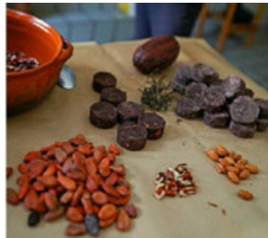
Iniciativa inquieta a productores de chocolate.

gobiernos los que establecen el precio. Colombia es el menos competitivo por la falta de claridad en cuanto a su demanda interna y los impuestos aplicados al combustible. En México, el precio de la turbosina ha bajado por una menor demanda y la reforma energética pretende traer a más competidores, pero todo se ha retrasado por la pandemia.