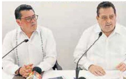
¡BIEN POR EL GOBIERNO DE BCS!