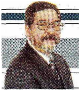
ESTIRA Y AFLOJA | J. Jesús Rangel M.