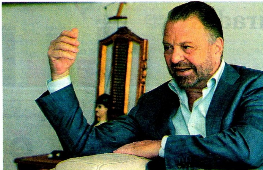
Jorge Castañeda, ex canciller, se unió al equipo de Ricardo Anaya.