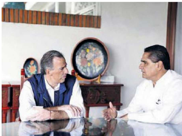
Silvano Aureoles Conejo

llama la atención no son los rítmicos pasos del grupo de bailarines, sino el gran salto de chapulín que la candidata quiere dar, debido a que para buscar una curul tuvo que pedir licencia en el Congreso local. Nos señalan que en la vida como en los negocios es fundamental saberse mover o brincar a tiempo y en ritmo.