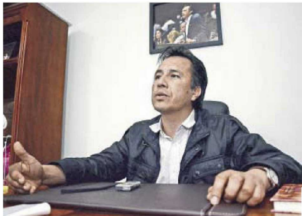
Cuitláhuac García Jiménez

lan, los agentes que llegaron al sitio permitieron que el joven huera y levantaron un acta asentando que era otra persona quien manejaba el vehículo; sin embargo, al ser un personaje conocido por la población, varios testigos lo reconocieron, contradiciendo esta versión. A la autoridad no le quedó de otra más que aceptar la falsedad de datos y comprometerse a investigar el caso.