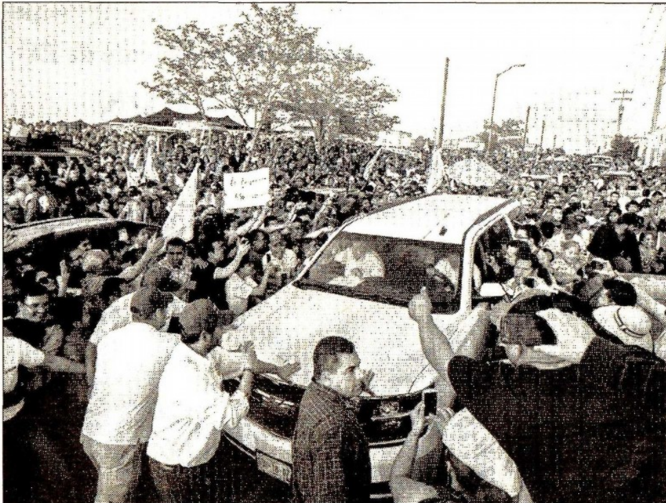
En Reynosa, Tamaulipas, una multitud da la bienvenida a Andrés Manuel López Obrador, candidato presidencial de la alianza Juntos Haremos Historia. En un mitin, el abanderado afirmó que por encima de sus diferencias con el mandatario Enrique Peña Nieto está el interés nacional, por lo que expresó su respaldo al mensaje emitido por el jefe del Ejecutivo contra las acciones de Donald Trump