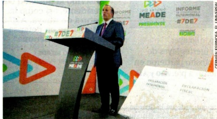
José Antonio Meade