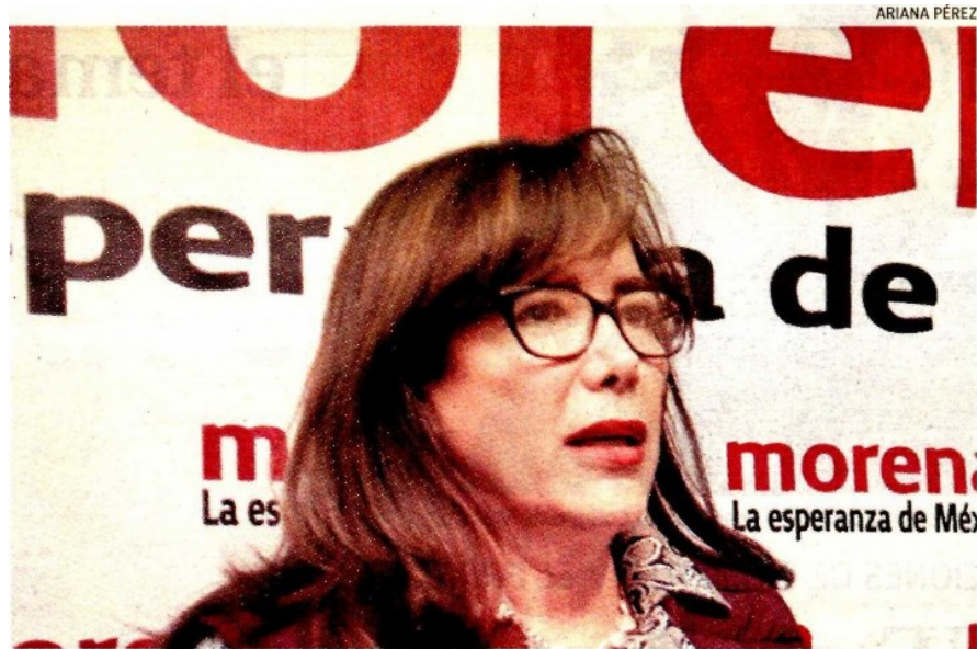
Veidrkol Polevskv. la mano derecha de López Obrador.