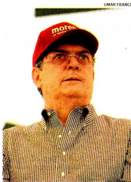
Marcelo Ebrard, ex jefe de Gobierno.