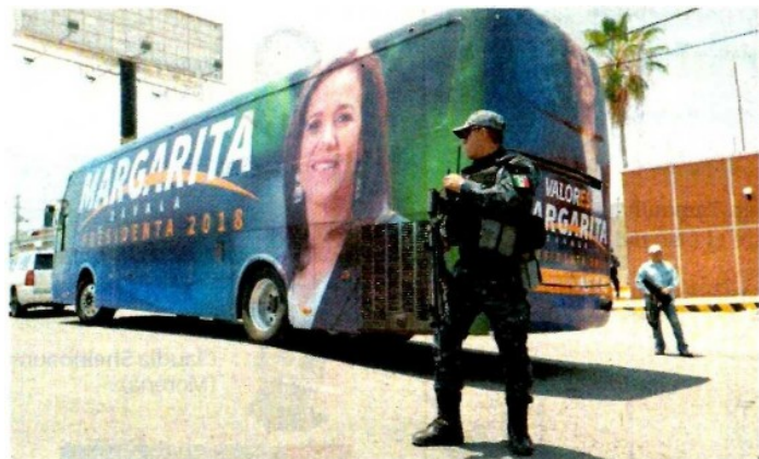
Autobús que utiliza Margarita Zavala en su campaña

“¡Wooooow!”, expresó Margarita Zavala , candidata presidencial independiente, cuando llegó a su casa de campaña el autobús que utiliza para los recorridos proselitistas. Sin embargo, le entró la duda y aún no decide qué nombre le pondrá y algunos de sus cercanos recordaron el camión que utilizó su marido, Felipe Calderón en la contienda de 2006 y que bautizó como “ El Hijo Desobediente ”, en abierta referencia a que el entonces candidato presidencial panista no era el preferido del entonces mandatario Vicente Fox . Doña Margarita viajó varias horas en este autobús, hasta Ciudad Altamirano, Guerrero, y tuvo oportunidad de bajarse en una tienda donde compró pan, aguas y refrescos y los repartió entre los elementos de seguridad y choferes que la acompañan. ¿Lo llamará “El Nieto del Hijo Desobediente”?