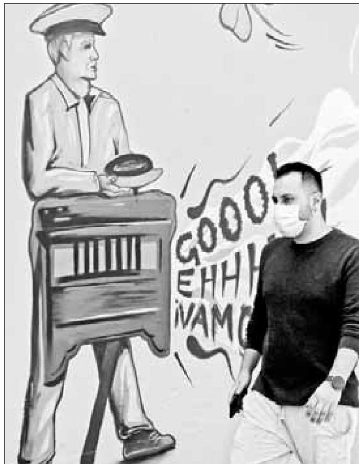
▲ Los organilleros se resisten a desaparecer de las calles de la Ciudad de México, donde han acompañado a transeúntes y comensales desde finales del siglo XIX.