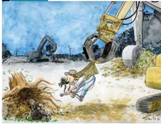
En el marco del Día Mundial de la Libertad de Prensa, el periodismo ante la crisis ambiental.