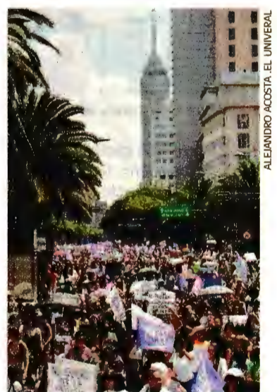
Unas 2 mil personas marcharon en la Ciudad de México por Mara.