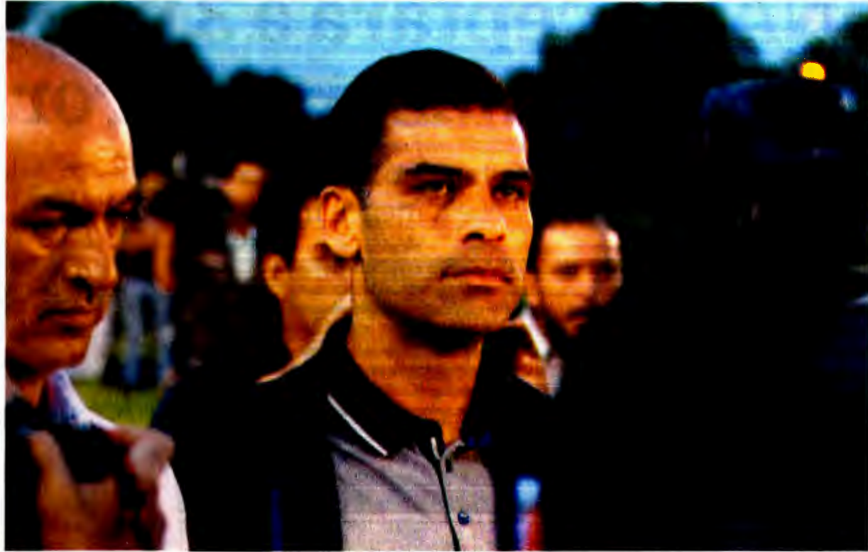
En un mensaje, el futbolista mexicano Rafael Márquez se dijo inocente y afirmó: "Es el partido más difícil de mi vida".