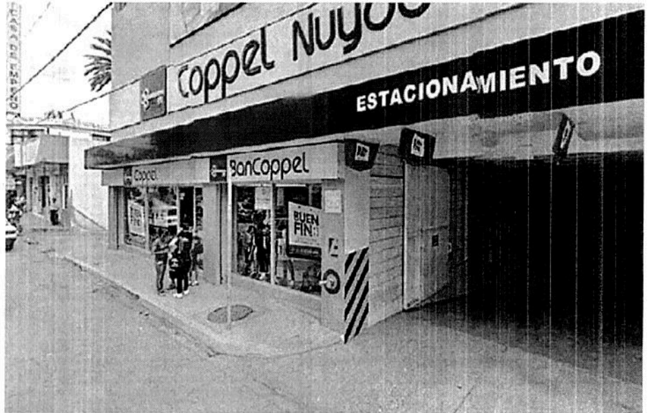
BanCoppel cuenta con una red de mil 39 sucursales

nales es fantástica. La sociedad está harta del derroche de los partidos y sus miembros. Expertos estiman sin embargo que puesto que ya inició el proceso electoral y se requieren cambios constitucionales, no hay tiempo para instrumentar. Además hay riesgos, máxime que ni siquiera se ha logrado instrumentar un Sistema Nacional Anticorrupción y no tenemos fiscal. Como quiera llegó el momento de discutir hacia esa fórmula con los candados correspondientes. Veremos si la "partidocracia" lo permite. M