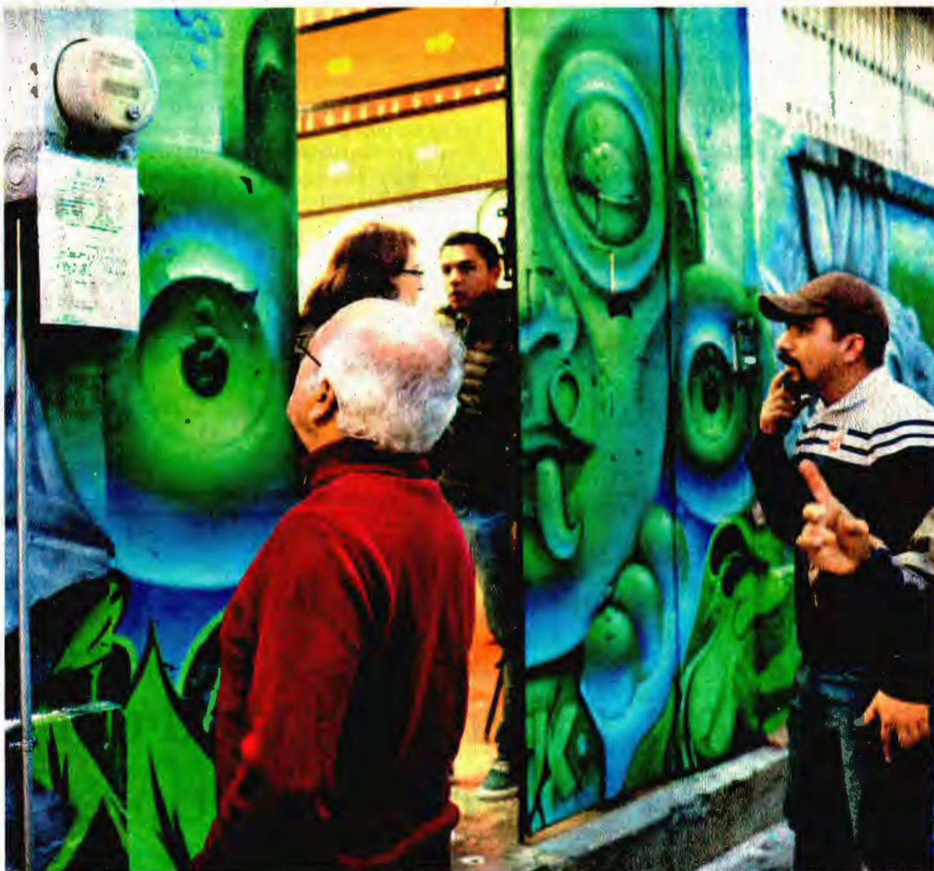
LOS PADRES de familia no se sienten tranquilos, un recorrido de El Sol de México da cuenta de las preocupaciones

El Presidente se reunió ayer con el jefe de gobierno capitalino, para evaluar la situación que prevalece en la Ciudad de México