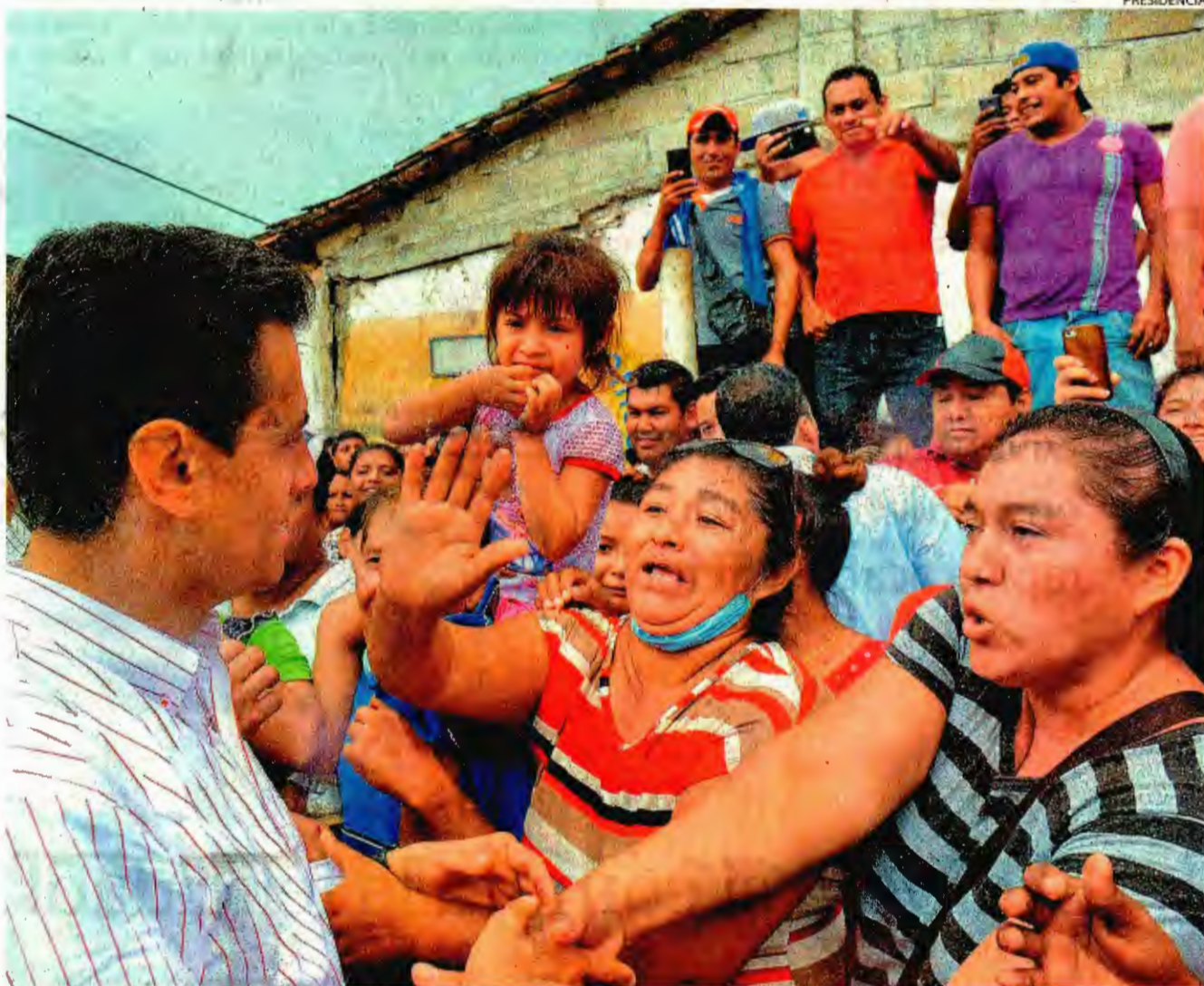
EL PRESIDENTE de México, Enrique Peña Nieto, pidió hacer un frente común para atender la emergencia