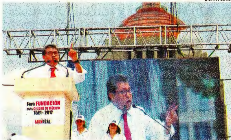
EN EL Monumento a la Revolución, Ricardo Monreal, delegado en Cuauhtémoc, presentó su proyecto Visión Metropolitana 2.5 y pidió apoyo

Monreal pidió el apoyo de los capitalinos, porque dijo estar listo para encabezar con Morena el renacimiento de la Ciudad de México. "Pido con humildad su apoyo", expresó.