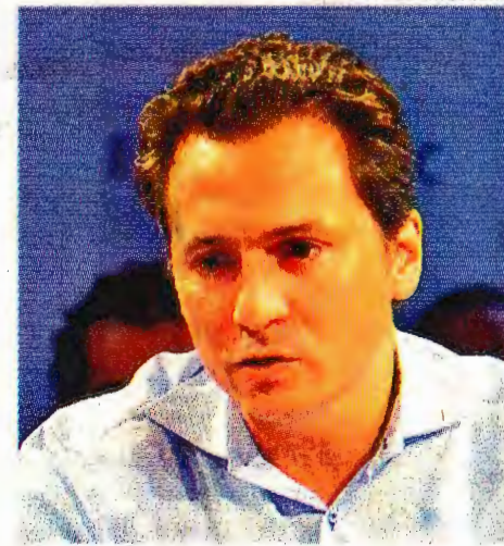
EL EXDIRECTOR de Pemex es señalado en la red de corrupción de la trasnacional