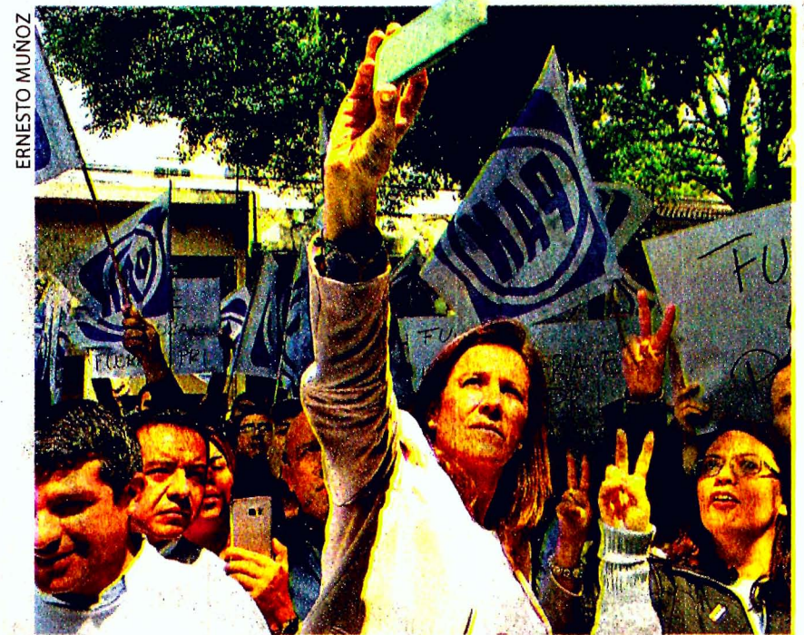
ERNESTO MUÑOZ MARGARITA ZAVALA inició su gira nacional, en la que recorrerá 18 mil kilómetros en 31 días, en busca de escuchar cara a cara el clamor de hombres y mujeres a lo largo y ancho del país. El arranque la llevó a Querétaro, en donde le pidieron los selfies para el recuerdo