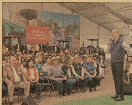
El gobernador del Edomex entregó incentivos por 15 millones 700,000 pesos, en tractores, equipo agrícola, cemento, entre otros.

Alfredo del Mazo destacó que también se apoya con programas especiales a las mu-