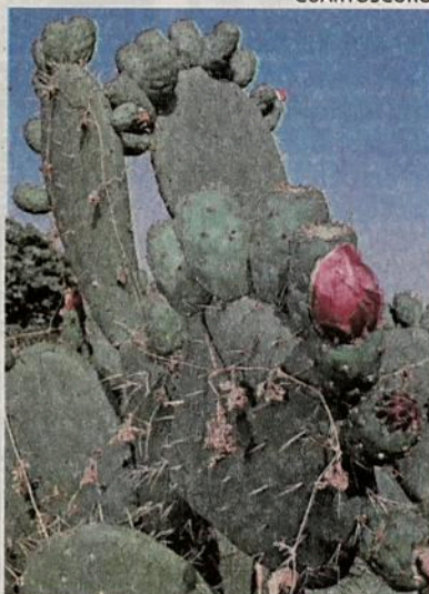
LA TUNA del nopal tiene la misma cantidad de azúcar que la manzana

la manzana y esto está científicamente demostrado, sin embargo, falta hacerle publicidad sobre sus bondades", puntualizó.