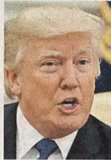
Donald Trump, Presidente de EU

En ese contexto, ayer, Herminio Blanco, ex Secretario de Economía de México y actual presidente de la agencia comercial IQOM,