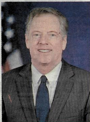
El representante comercial.

Su comparecencia generó opiniones encontradas entre los republicanos y demócratas del Comité de Finanzas sobre los