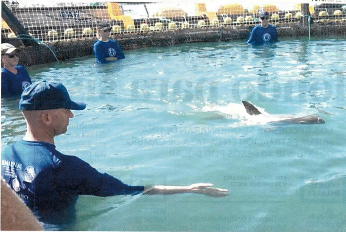
• ESTUDIOS. A pesar de que regresaron el ejemplar al mar, le tomaron muestras para análisis.