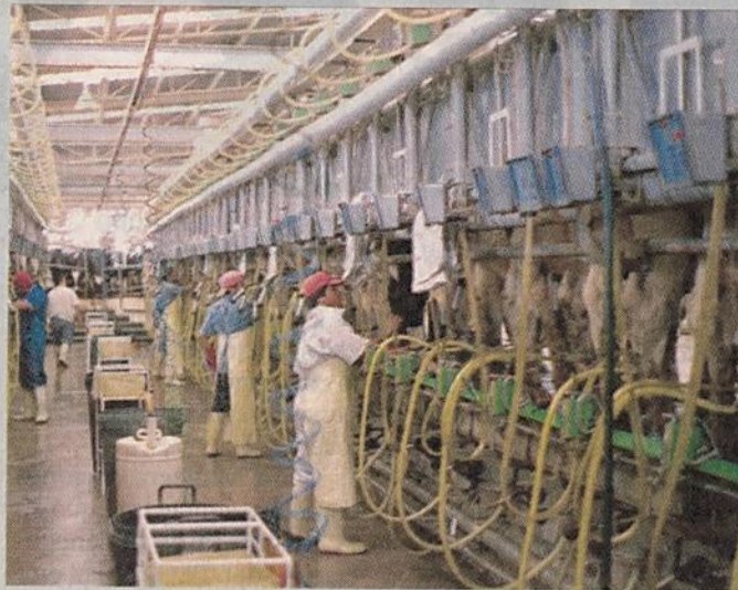
■ Los productores de leche han visto mermadas sus ganancias.

Sin embargo, González destacó que en 2017 el precio promedio de un litro de leche es de 17 pesos, de los cuales al productor sólo le