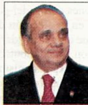
Manuel Añorve Baños

Sin duda alguna, el sector agroalimentario es uno de los principales motores de la economía mexicana, arrojando grandes beneficios para la población mexicana al tiempo de consolidar una transformación progresiva y benéfica para el país. Sin duda, el trabajo de José Calzada Roviroso al frente de la Sagarpa ha sido fundamental no sólo para darle rumbo a la política agroalimentaria, sino también para la obtención de resultados positivos.