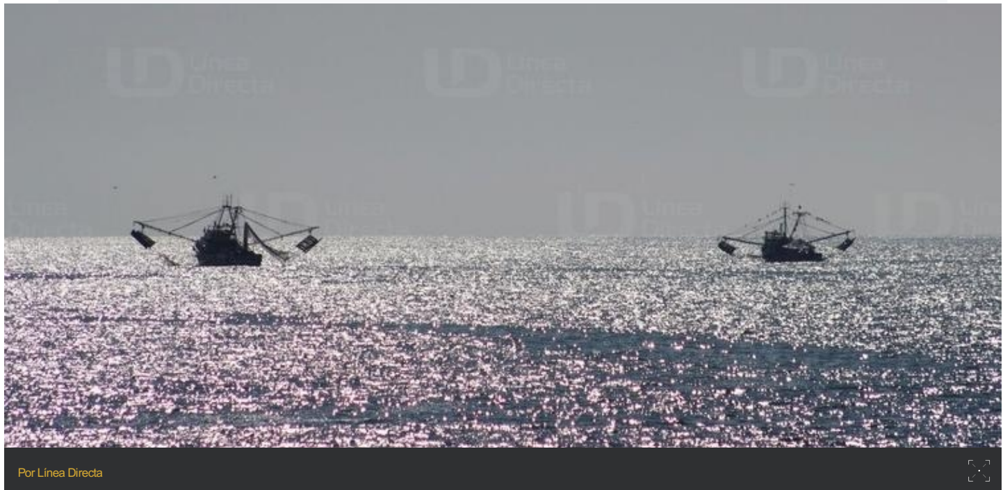
Por Línea Directa