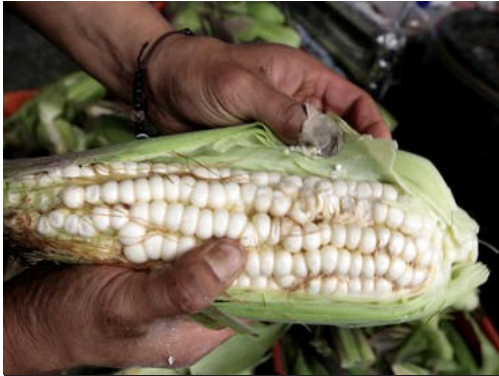
Buscan ir más allá del intercambio comercial, como la colaboración, cooperación e inversión en sectores agroalimentarios.

TLCAN | Economía Mexicana | Estados Unidos | Sagarpa