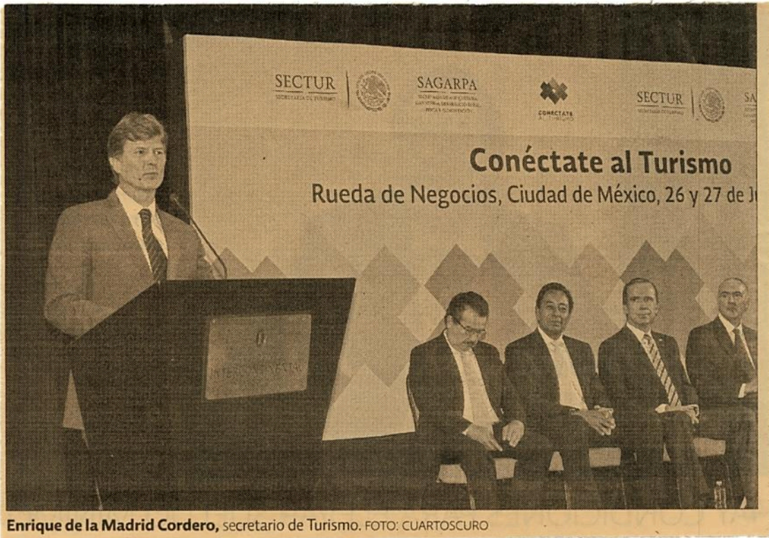
Enrique de la Madrid Cordero, secretario de Turismo.

El titular de la Sectur, Enrique de la Madrid, y de la Sagarpa, José Calzada, presentaron la plataforma Conéctate al Turismo para fortalecer las cadenas del sector. P22