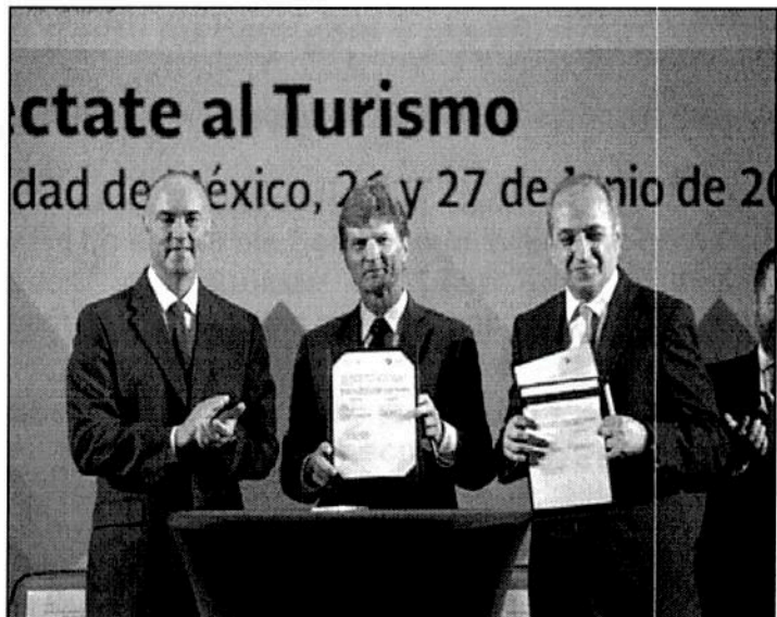
Los secretarios de SAGARPA, José Calzada- izq- y de Turismo, Enrique de la Madrid, en Rueda de Negocios

Por cuanto a la Rueda de Negocios CDMX del programa "Conéctate al Turismo", el secretario de Turismo coincidió con el