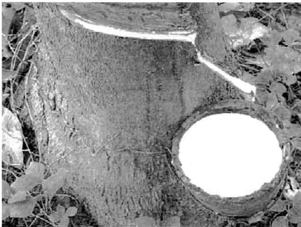
Tailandia, es el principal productor mundial de hule natural y México quiere aumentar su participación en el mercado de este producto.

o sintético. Y específicamente en la producción total de neumáticos, el 70 por ciento utiliza hule sintético y 30 por ciento el de origen natural. Tailandia es el principal proveedor de planchas estriadas ahumadas de hule, con aproximadamente la mitad de la producción mundial de hule natural.