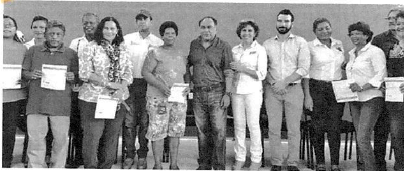
Héctor Astudillo resaltó el restablecimiento del servicio de agua en el municipio.

Asimismo, el mandatario estatal señaló que se trata de un esfuerzo conjunto, en el que la participación decidida de todas las instancias ha sido el factor para alcanzar los objetivos planteados.