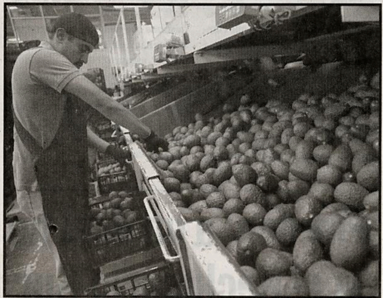
El fruto verde bajó en tiendas de autoservicio a 65.06 pesos.

Finalmente, los mercados de Guadalajara vendieron el fruto verde en 73 pesos, el jitomate en 25, el huevo en 23, el endulzante en 20.50, la cebolla en 20 y el limón hasta en 14 pesos por kilogramo.