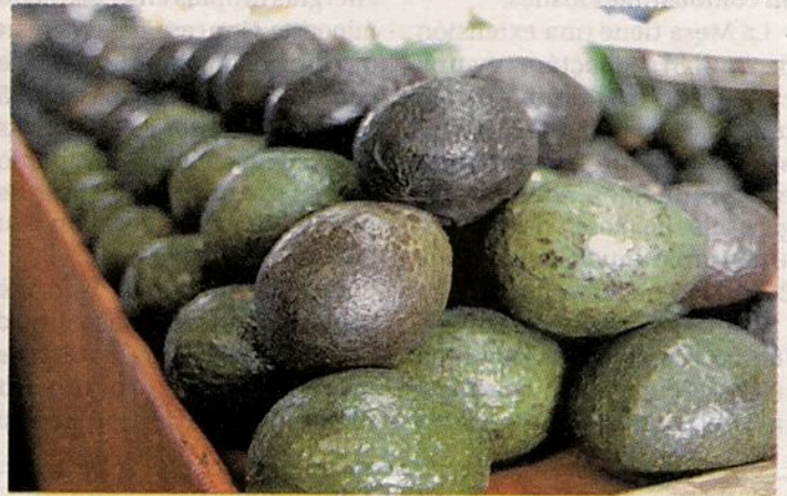
En Tijuana el aguacate se vende hasta en $90.

En Monterrey el aguacate bajó 5 pesos y quedó en 50. M