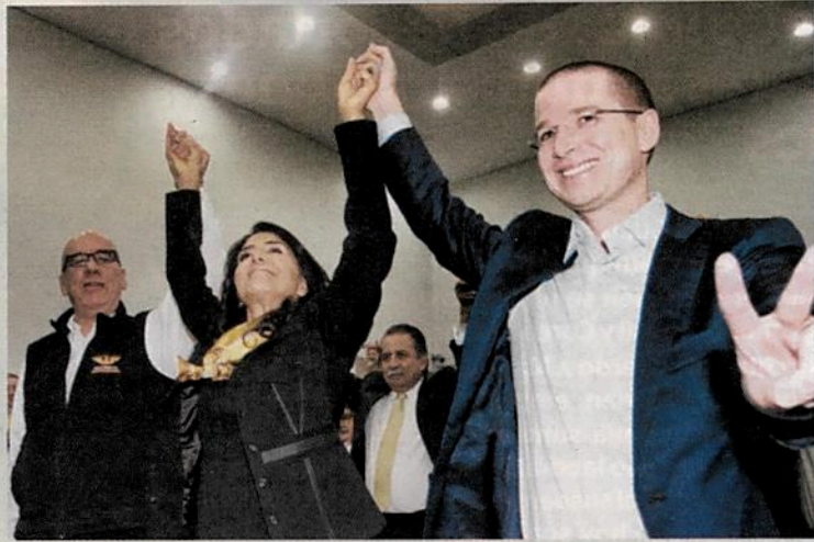
El Frente Opositor que conformaron el PAN, PRD y Movimiento Ciudadano (MC) ya ha dado muestras de que presionarán al PRI.

de cómo se comportará el Congreso en el año previo a la elección presidencial.