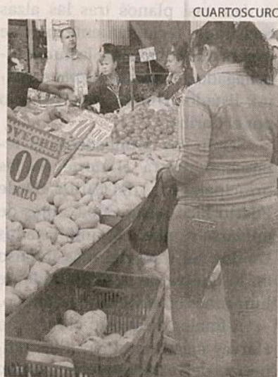
AL NO existir condiciones estacionales no se justifica su alza