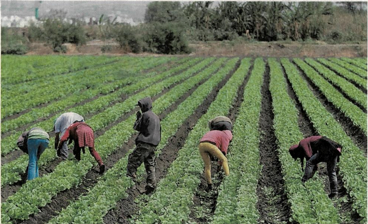
CÉSAR CÓMEZ. EL UNIVERSAL