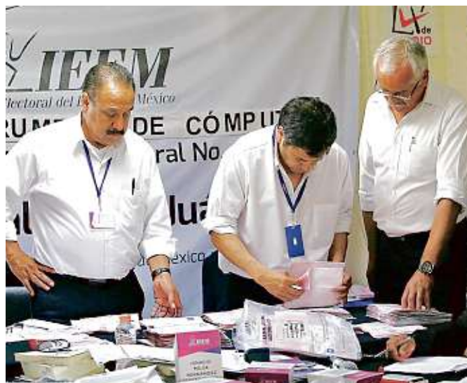
El recuento de votos en el Estado de México concluyó prácticamente ayer. En la imagen, en el Municipio de Naucalpan.