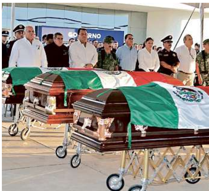
CIUDAD VICTORIA. Los tres policías estatales que murieron en la balacera del martes en el interior del penal recibieron ayer un homenaje de las autoridades de Tamaulipas.