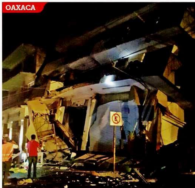
En Matías Romero, un hotel se colapsó sin que se reportaran víctimas mortales.

En el Aeropuerto Internacional de la Ciudad de México hubo cristales rotos en la puerta 4 de la Terminal 1, indicó Raúl Esquivel, jefe de bomberos capitalino.