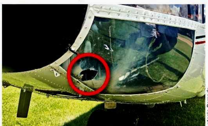
Los maestros de la CNTE no sólo dañaron el helicóptero, también incendiaron varios vehículos.

ral y de Convenciones, policías estatales y federales replegaron a los manifestantes lanzándoles gas lacrimógeno.