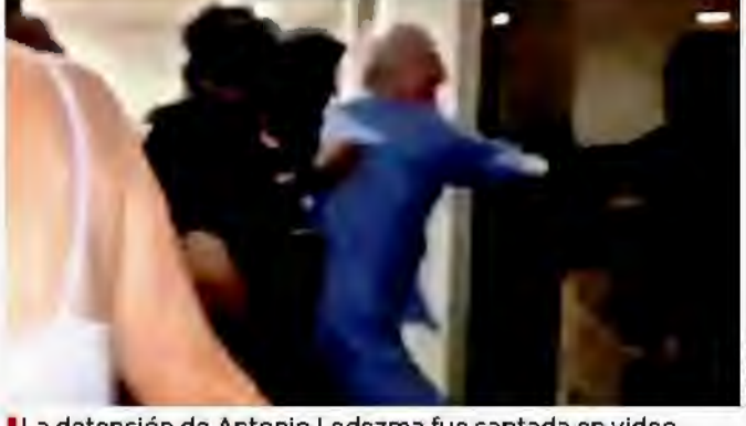
La detención de Antonio Ledezma fue captada en video.

En sus mensajes, piden a los venezolanos seguir la lucha para renovar los poderes