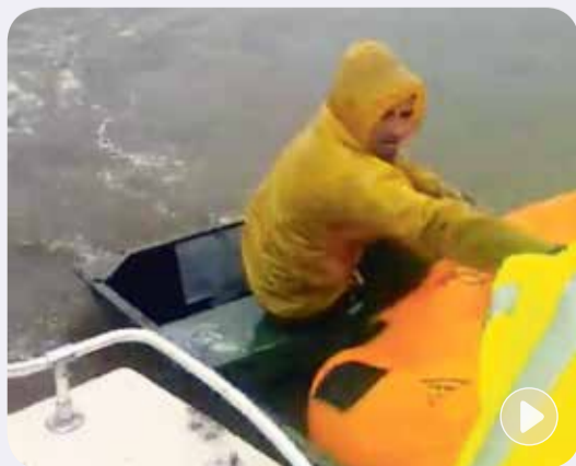
El primer viaje que hicieron fue para salvar a un familiar, después siguieron trabajando para recoger a extraños.