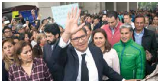
RICARDO Monreal acompañado de simpatizantes, ayer, en la explanada de la demarcación Cuauhtémoc.

AFIRMA que la reposición ayudará a recuperar la confianza en su partido; niega que dejará esas filas para liderar alianza con otras fuerzas políticas