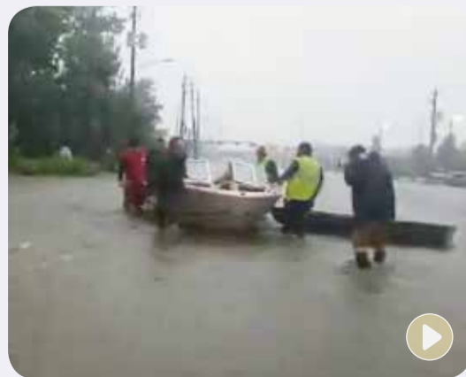
Momento en que el grupo empuja el bote para intentar contrarrestar la fuerza del agua.