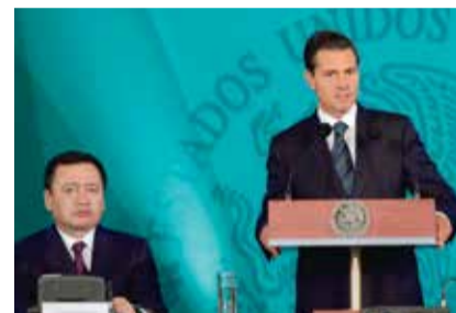
EL MANDATARIO (der.) con el secretario de Gobernación, Miguel Osorio, ayer.