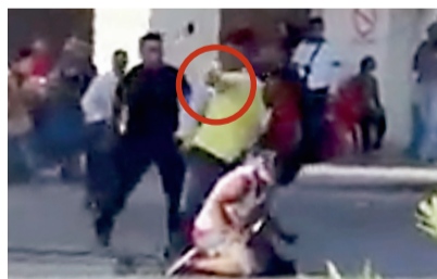
Momento del ataque con el arma (círculo).

En Cancún graban riña que deja saldo de un muerto.