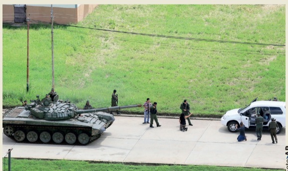
SOLDADOS a bordo de un tanque revisan un vehículo en las inmediaciones del fuerte Paramacay, ayer.

» Tropas afines al régimen movilizaron un tanque para disuadir a la gente que pretendía apoyar a los rebeldes; el gobierno afirmó haber apagado el alzamiento al que calificó como una acción de terroristas págs. 21 y 22