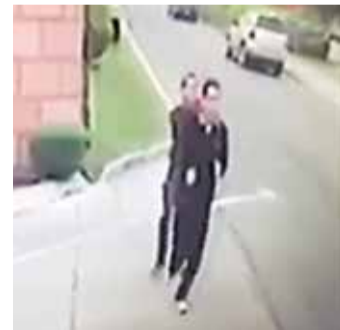
Momento en el que asesina al juez; en el video no se aprecia bien su cara.

La mañana del 17 de octubre de 2015 el homicida huyó en un Tsuru blanco con logotipos de Metepec; viajaba en la parte de atrás con otro sujeto.