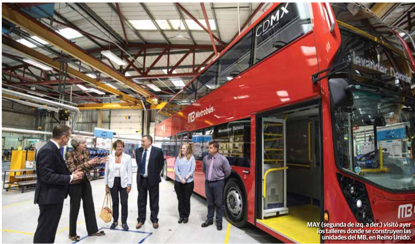
MAY (segunda de izq. a der.) visitó ayer los talleres donde se construyen las unidades del MB, en Reino Unido.

THERESA MAY , primera ministra de Reino Unido, destacó el envío de 90 unidades para la Línea 7 que circulará por Reforma; el gobierno británico asegura que los autobuses de doble piso reducirán la polución en la capital mexicana. pág. 14