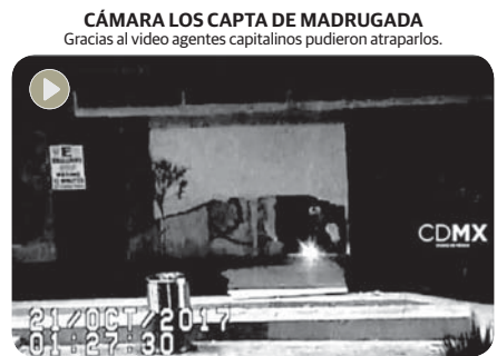
Los ladrones hicieron un boquete para ingresar a la tienda.