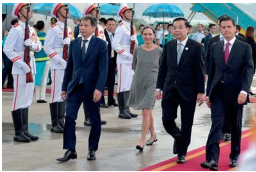
EL MANDATARIO (der.) a su llegada al aeropuerto de Vietnam, ayer.