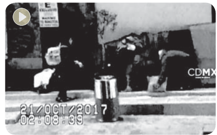
Momento en el que los delincuentes sacan mercancía.