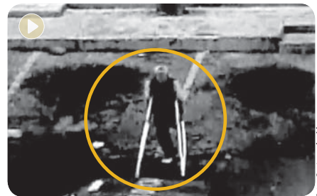
Con todo y muletas el jefe de los hampones trató de correr.