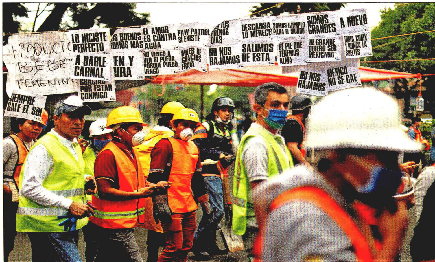
Trabajadores y voluntarios de rescate pasan ayer en la capital mexicana junto a pancartas de ánimo.

Miles de personas siguen trabajando en inmuebles dañados por el sismo