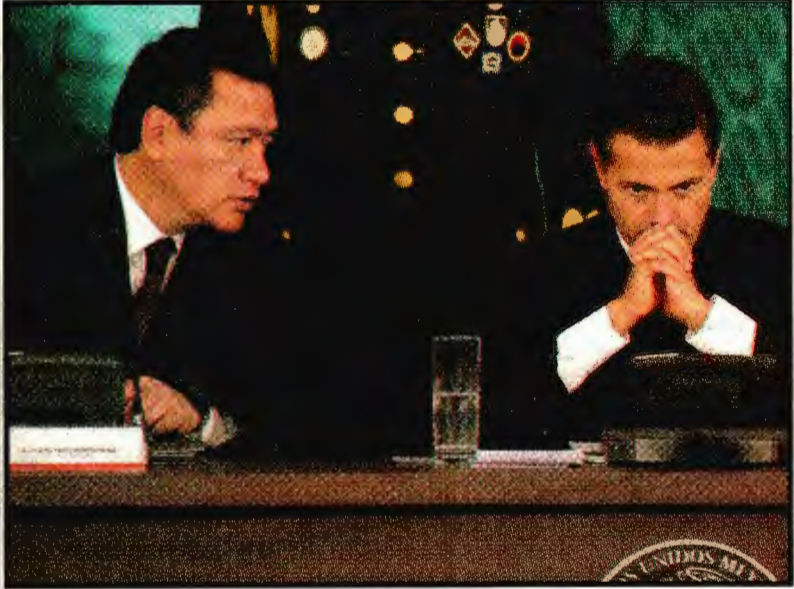
Enrique Peña Nieto y Miguel Ángel Osorio Chong.