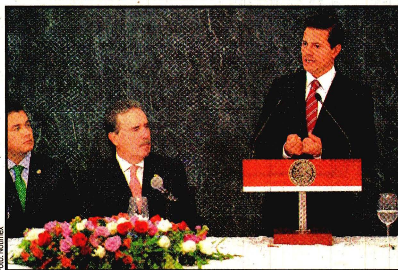
Enrique Peña Nieto comió ayer con senadores del PRI, en Los Pinos, en vísperas del inicio del periodo ordinario de sesiones del Congreso.