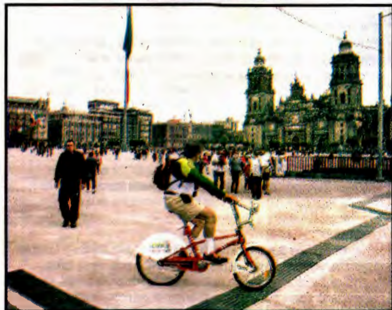
El Zócalo capitalino, un día después de ser reinaugurado.